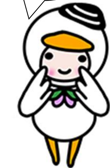
苫小牧市公式キャラクター 『とまチョップ』